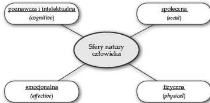
Diagram 2. Sfery natury człowieka