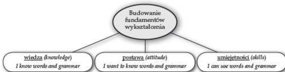
Diagram 1. Budowanie fundamentów wykształcenia

praktycznych ( skills ). Zatem ważne jest, aby na każdym etapie edukacyjnym zdobywanie nowej wiedzy było skorelowane z rozszerzaniem umiejętności jej praktycznego zastosowania oraz żeby było oparte na wszechstronnym, harmonijnym rozwoju osobowości każdego ucznia.